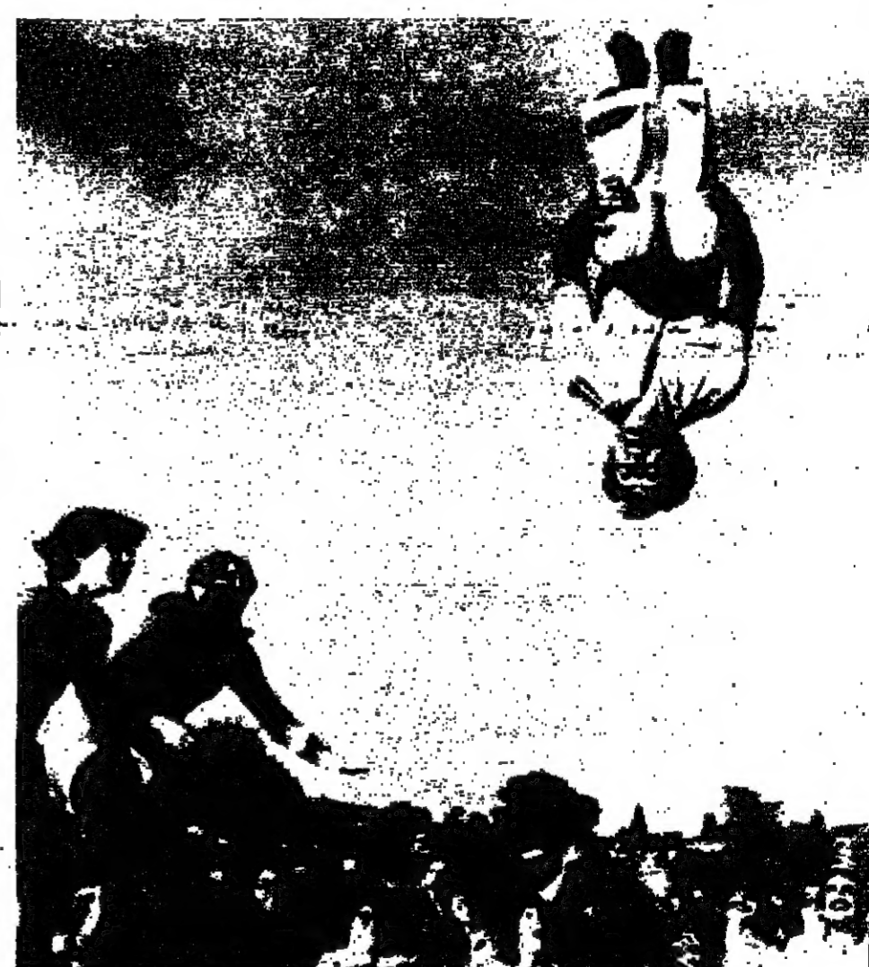
ليست هذه الصورة لرياضي يؤدي لعبة خطيرة . انها ايضاً لرواد رئيس وزراء كندا وهو يمارس هوايته المفضلة على جهاز التزلج المتحرك اثناء احدى الرحلات التي قام بها في مدينة فانكوفر بكندا